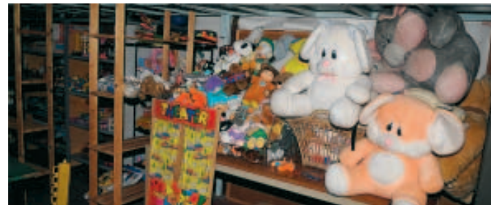
Un rayon spécial jouets pour la Saint-Nicolas. ■ E.G.

Les parents pourront aussi trouver leur bonheur au "rayon" puériculture. D'une rangée de poussettes, Alex Lecocq en extrait une bleue, tou-